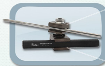
Conector Rápido Haste 11mm - Pino 4-6mm