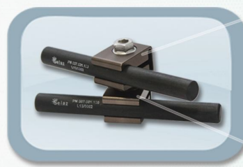
Conector Rápido Haste-Haste 11mm

Permite engate rápido das hastes pela lateral