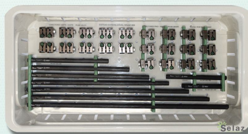
Hastes e Conectores - Estojo Esterilizável Selaz 009 Anvisa 80836140003